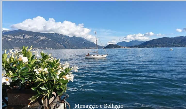
Menaggio e Bellagio