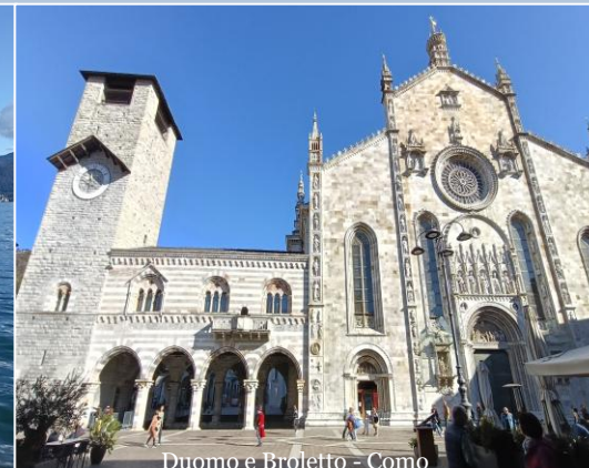
Duomo e Broletto - Como