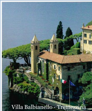
Villa Balbianello - Tremezzina